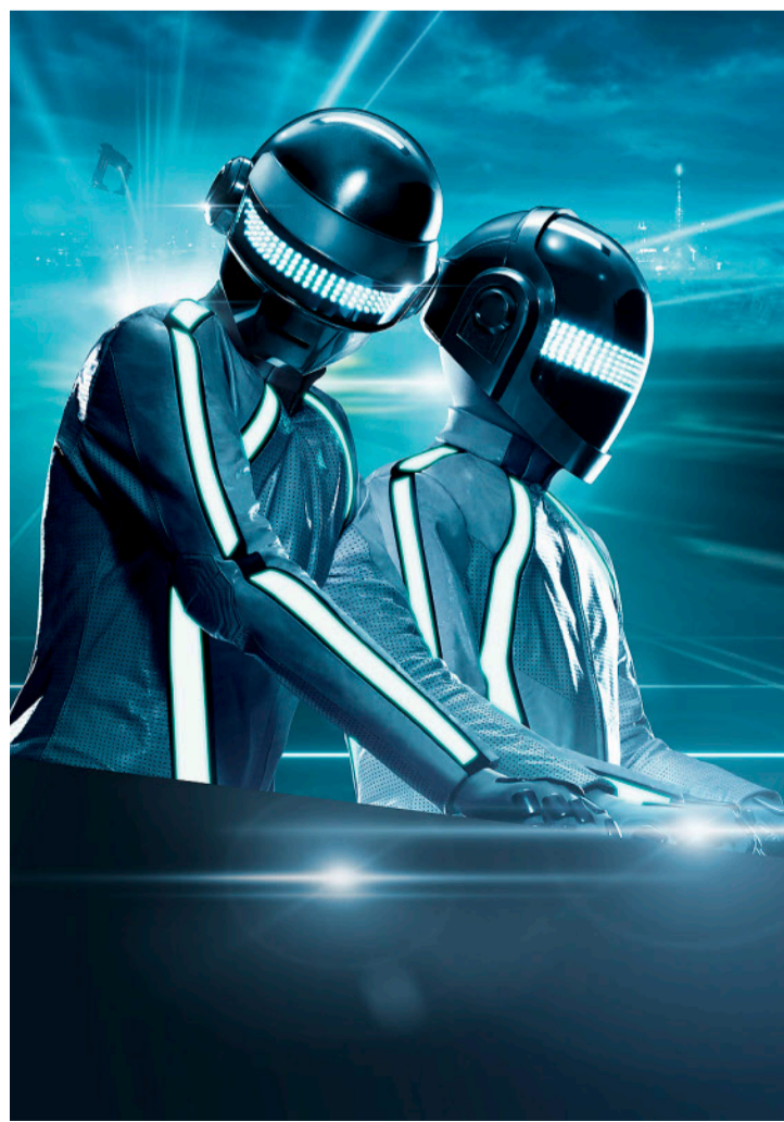
Wagen den Schritt zu handgemachter Musik: Daft Punk.